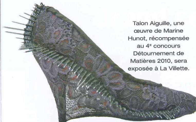
Talon Aiguille, une œuvre de Marine Hunot, récompensée au 4 e concours Détournement de Matières 2010, sera exposée à La Villette.

C haque année depuis 2004, le salon L'Aiguille en Fête connaît un succès croissant. Nul doute qu'en 2011, il crée à nouveau l'événement. Pour cette 8 e édition, pas moins de 230 exposants sont attendus sur plus de 12 000 m 2 de surface aménagés à la Grande Halle de la Villette, à Paris. L'Aiguille en Fête se veut la plus importante manifestation de France exclusivement dédiée aux "ouvrages de dame", comme le précise Vanessa Machenaud, commissaire général du salon. Au programme : des stands où pullulent les idées et les produits nécessaires à leur réalisation, mais aussi des ateliers et animations uniques, dont l'incontournable Speed Knitting®, qui n'est autre que le championnat de France de vitesse de tricot. Côté Salons, la société organisatrice, résume en quelques mots ses intentions par la voix de Vanessa Machenaud : "Notre volonté est de permettre aux visiteurs de voir, admirer, toucher, apprendre et acheter s'ils le désirent." Et d'ajouter : "Trop longtemps considérées comme « ringardes », les activités de création textile ont petit à petit été remises au goût du jour." Au fil des ans, l'Aiguille en Fête s'est imposé comme le grand rendez-vous des amatrices de broderie, tricot, boutis, couture ou encore patchwork. Savoir-faire, créateurs et créatrices, modèles, patrons et matières, les loisirs créatifs textiles ont le vent en poupe. Cette année encore, plus de 30 000 visiteurs sont at-