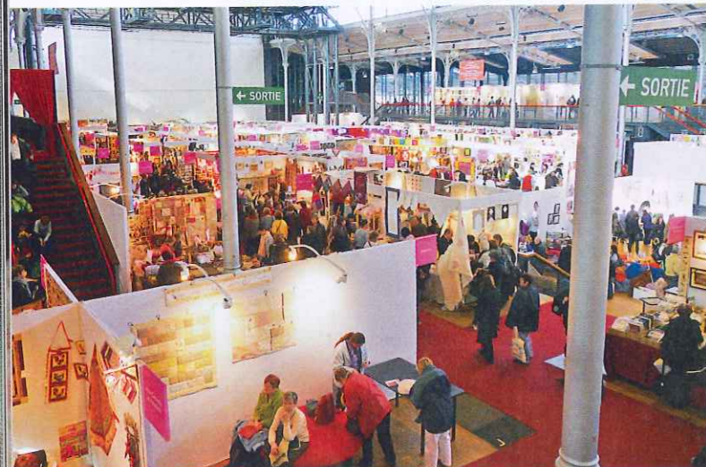
La Grande Halle de la Villette accueille la 8 e édition du salon L'Aiguille en Fête du 10 au 13 février 2011.