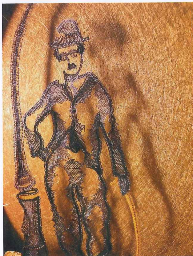
Une œuvre de Catherine Hervé, l'une des dentellières qui animeront les ateliers de L'Aiguille en Fête.

Du 10 au 13 février prochains se tiendra l'édition 2011 du salon l'Aiguille en Fête.