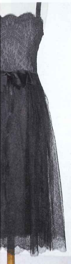
Ci-contre. Robe Lanvin - Musée de Caudry