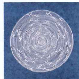
Dentelle aux fuseaux - Dendrovortex par Nicole Valsesia-Lair.