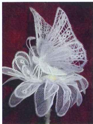
Ci-dessous. Papillon blanc 3 D à la dentelle aux fuseaux par Catherine Hervé