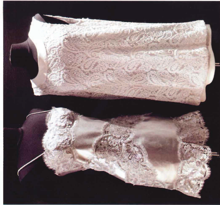
Robes d'Olivier Pétigny.

grand prix de la Création de la Ville de Paris et du prix Beittencourt pour l'Intelligence de la main, cette brodeuse talentueuse est une habituée du monde de la haute couture. Chacun a d'ailleurs constaté la rigueur, la minutie et le souci du détail se dégageant de son tableau textile en dentelle exposé au salon. Une création bouleversante, élaborée avec une finesse, une élégance et une inventivité propre à la jeune femme, habitée par une imagination débordante. A cet ouvrage incontournable, s'ajoutaient ceux de Pascaline Rey. Offrant une seconde chance à la lingerie féminine, la créatrice a donné naissance à de superbes mêluses, composées de bas, collants, dentelles, tulles et satin de corsets, bustiers, porte-jarretelles, jarretières... Travaillant sur le thème de la féminité et de la séduction, l'artiste avait décliné ces étranges créatures comme une galerie de