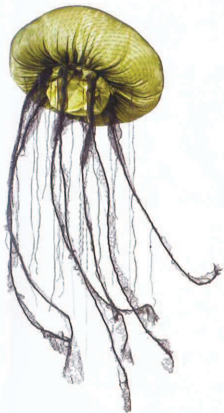
L'une des majestueuses méduses de Pascaline Rey

Cette année encore, le salon de l'Aiguille en fête a attiré les inconditionnelles de l'univers textile de France et de Navarre. Les fans de broderie, de couture, de patchwork, de tricot... se sont donc donné rendez-vous